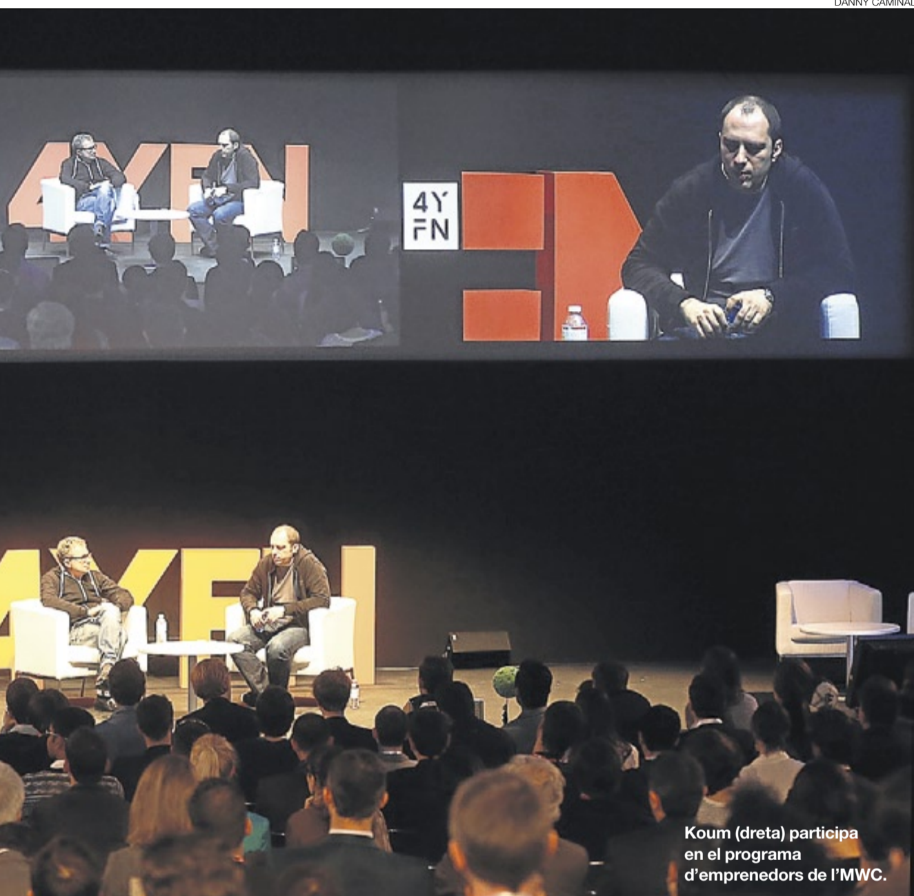
Koum (dreta) participa en el programa d'emprenedors de l'MWC.